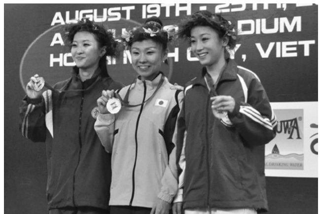
女子太極拳で金メダルを獲得した宮岡愛選手(中央)。表彰台で