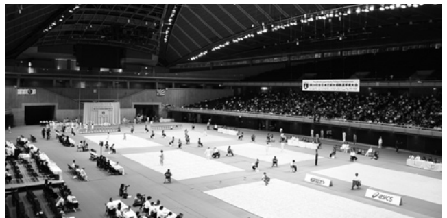
昨年の「第28回全日本武術太極拳選手権大会」の様。7月10日・東京体育館

「第29回全日本武術太極拳選手権大会」は3日間とも9時45分に競技開始。参観料は3日間通しで1000円。当日会場入口で販売する。今年は会場の東京体育館の都合で6月の開催となった。大会の様子はNHKのBS1で6月24日(日)13時～13時50分に放送予定。