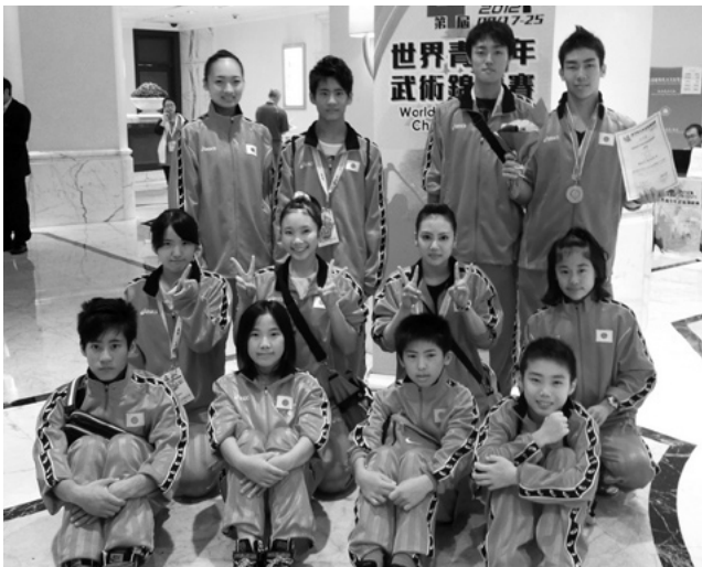
日本代表選手12人全員がそろって

国際武術連盟(IWUF)が主催し、マカオ武術総会が主管して「第4回世界ジュニア武術選手権大会」が、9月19日~23日に中国マカオで開催され、40カ国・地域から800人の選手と関係役員が参加した。