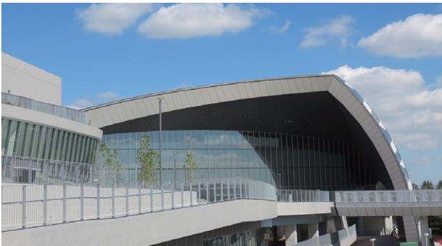
今年の会場となる「武蔵野の森 総合スポーツプラザ」

出場申込み(エントリー)が4月10日に締め切られ、自選難度種目を除く個人競技25種目に男女1,420人(男