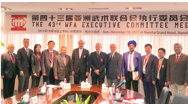
アジア武術連盟執行委員会会議も開催された

WFAは1987年9月25日に日本で設立され、2014年にマカオに移転されるまで日本が事務局を担ってきた。今後もアジア諸国・地域と協力し、アジアの友好と武術の発展のため努力していく。