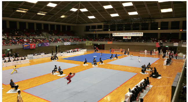
コートは4面。今年から第1コートは国際大会仕様に

今大会も、国際第三套路と長拳B、初級長拳(それぞれ器械種目を含む)は7ブロックによる選抜での出場枠が設定され、新たに年齢A組に「国際第三套路・南棍」「国際第三套路・長拳長器械」、年齢B組に「南棍(部門B)」の種目が導入された。