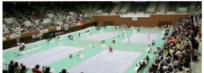
前回の京都大会(第22回大会)の競技の様様

各都道府県連盟から日本連盟への出場申込書の提出期限は、2019年1月15日(火)まで。所属の都道府県連盟の書類提出期限に注意されたい。