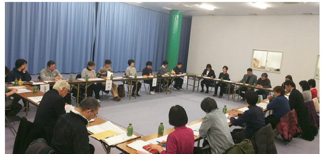
全8ブロックの実務担当者が集まり真剣な話し合いが行われた

次ページより2019年茨城大会の実施要綱と2018年度の選抜大会実施予定を掲載する。