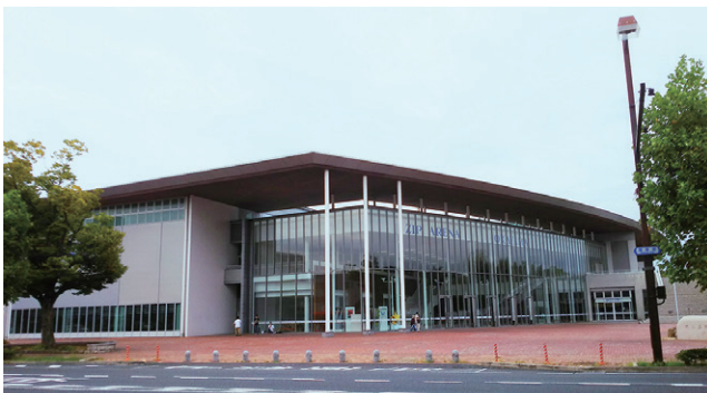
「岡山県総合グラウンド体育館(ジップアリーナ岡山)」外観

なお、岡山市内での宿泊については、利便性の高いホテルを多数用意し、受付は専用ホームページ等を2019年1月15日(火)開設の予定で準備している。大会の詳細等については後日発表する。