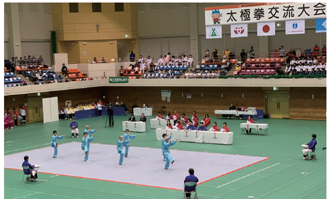
コートは1面。各チームが趣向を凝らして演武した

大会は、富山県連盟・金尾雅行会長の開会宣言で開始し、大会会長・森雅志富山市市長のご挨拶が代読さ