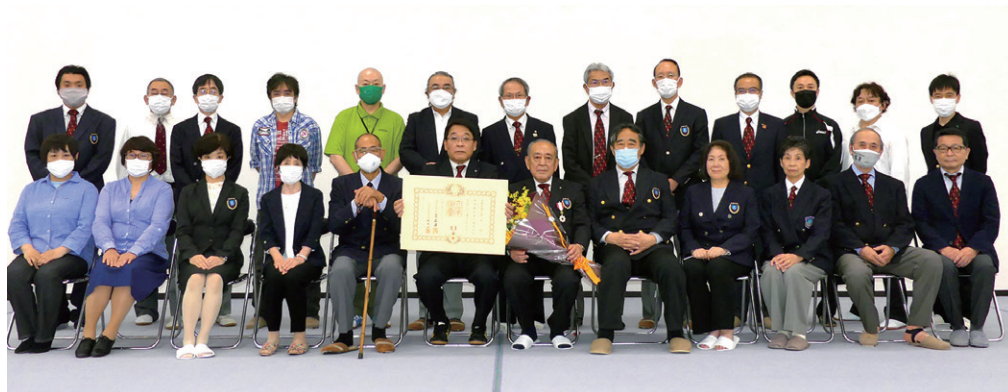
岡崎会長代行を中心に役員で記念撮影