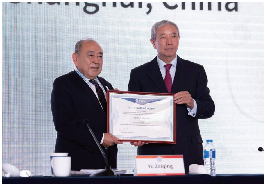
令和元年10月、終身名誉会員の称号が贈られる岡崎会長代行（左）