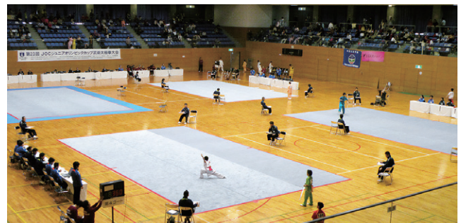
前回の神奈川県大会(第23回大会)の競技の様相