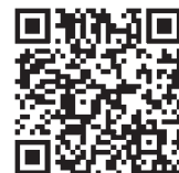
日本代表選手団と成績一覧

日本武術隊の成績は以下の表をご参照ください。全競技の成績はマレーシア武術連盟ホームページ( https://wushumalaysia.com/ )にてご覧いただけます。