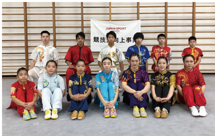
選考会に挑んだジュニア選手たち