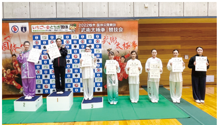
表彰台で笑顔を見せる成年女子総合太極拳(自選)の入賞者たち

いただきました。この3年間、開催に至るまでご尽力いただいた加盟団体含め関係された全ての皆さまに改めて感謝申し上げます。