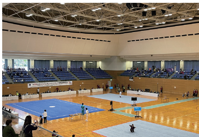
2019年京都大会から3年ぶりとなる開催となった

また、参加者全員がPCR検査や抗原検査を実施し、徹底した感染防止対策のもと大会を行いました。