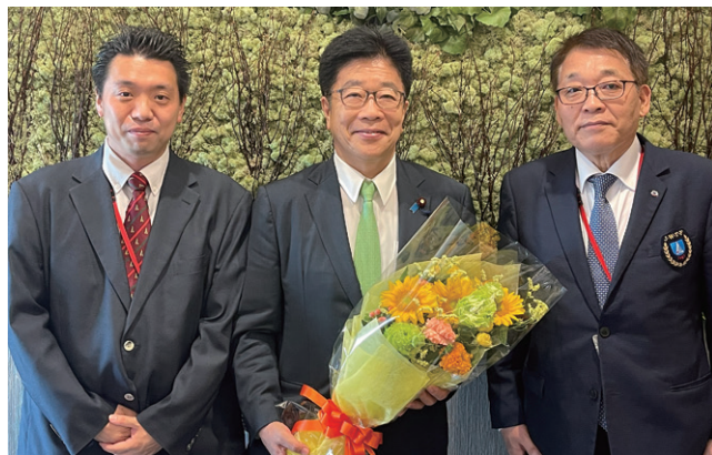
加藤勝信会長(中央)と。川崎副会長(右)、長江事務局長(左)

活躍も愛好者のモチベーション向上に繋がっていきます。2019年に地元岡山で開催した第36回全日本選手権大会も地域の武術太極拳の取り組みに大きくプラスになったと感じております。