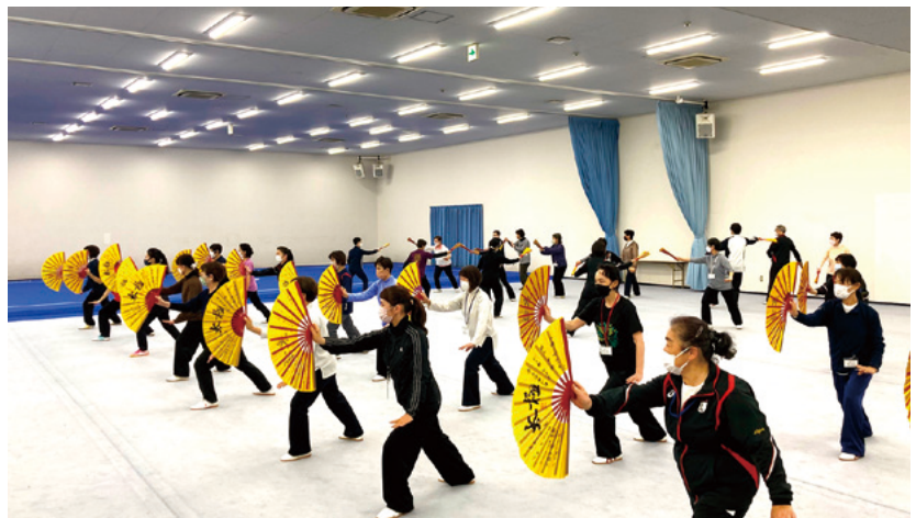
昼休憩時間にも熱心に練習する日本連盟講師陣