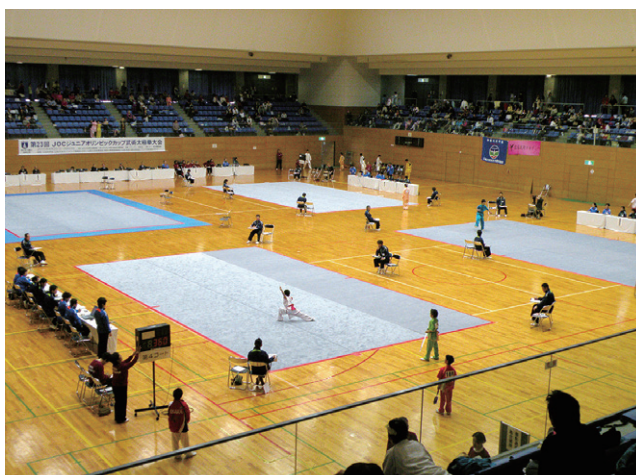
2015年に開催された神奈川大会の様子

本大会は国際大会(世界ジュニア選手権、アジアジュニア選手権)に合わせ、全種目に新国際競技ルール