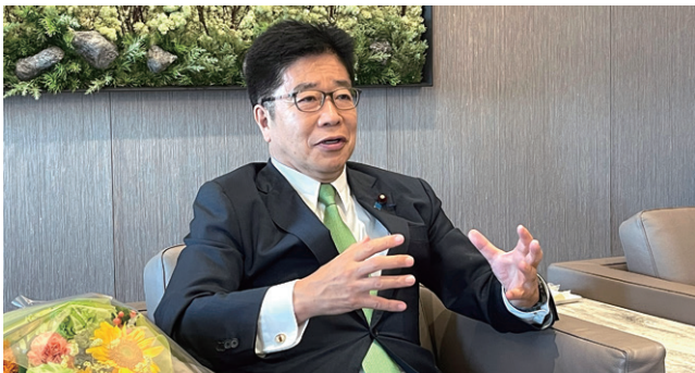
会長就任にあたり、インタビューにお答えいただいた

また、山は頂が高いから裾野が広く広がると常々申しておりますが、生涯スポーツ、競技スポーツとしての武術太極拳の発展には、トップアスリートの世界大会、全国大会などでの