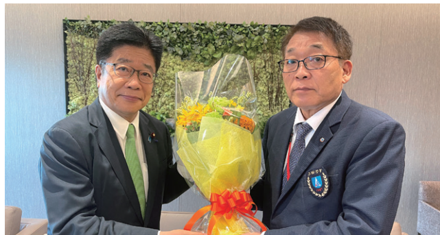
川崎副会長兼専務理事より花束が手渡された